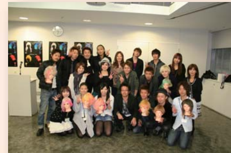
2010年11月【第7回CL杯】 資生堂/汐留FSビル